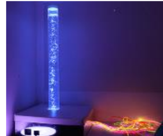
Un espace sensoriel