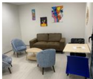
Une salle d'accueil Famille