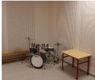
Une salle de musique