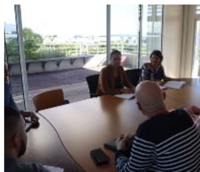
Des espaces partagés (salle de convivialité, salle de réunion)

Les espaces d'accueil de l'IME – en tant qu'Établissement Reçevant du Public (E.R.P.) handicapé – sont régulièrement vérifiés par des organismes certifiés afin de répondre aux normes de sécurité et d'hygiène.