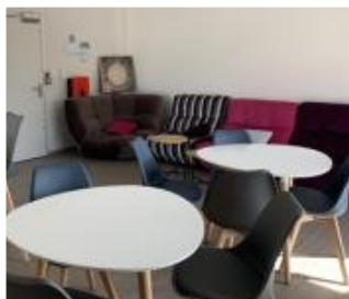
Une salle de convivialité