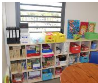
Un espace pédagogique