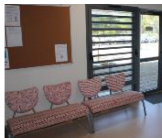
Un espace d'accueil à l'entrée