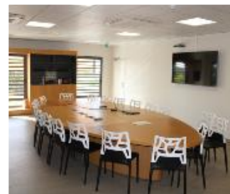
Deux salles de réunion