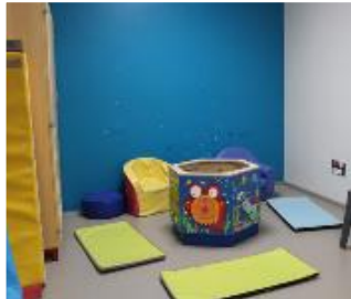
Un espace d'apprentissage Montessori