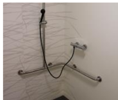
Un espace douche

Le Dispositif relais, situé dans des locaux annexes, dispose de :