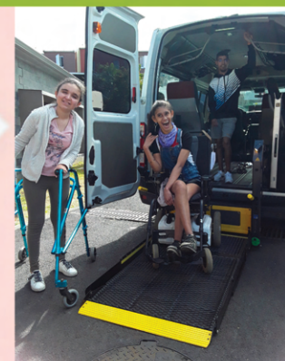
Arrivée à l'IMS

Préparation avant de rentrer à la maison (soins d'hygiène)