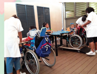
Temps du repas